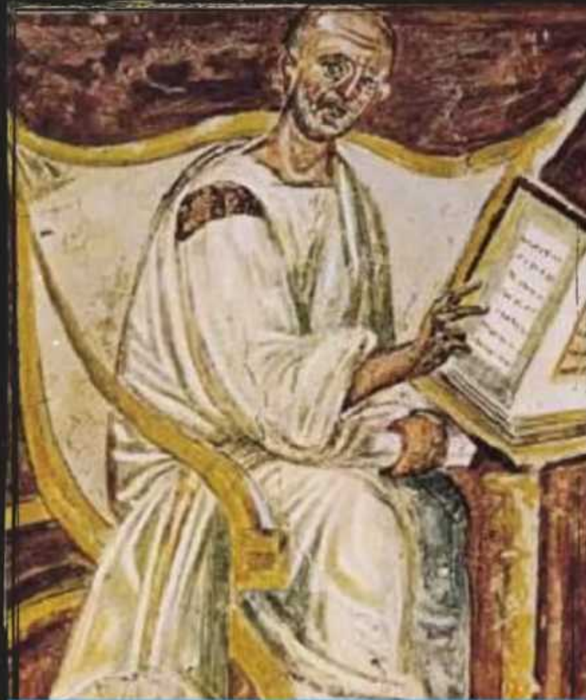
Agustín de Hipona