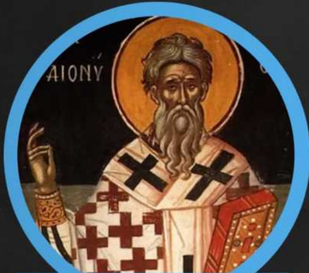
Dionisio el Grande